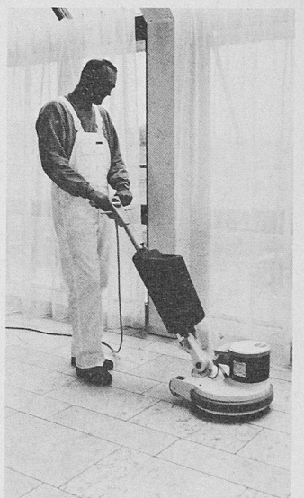
Das Sorma-Marble-Shine-System ist wesentlich effizienter als traditionelle Schleiftechniken