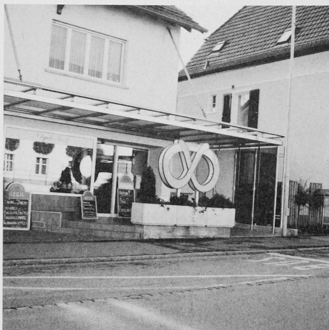
Unterstand aus Edelstahl und Glas in Wangen bei Olten

Zettler AG 5032 Rohr/Aarau Tel. 064/22 70 71