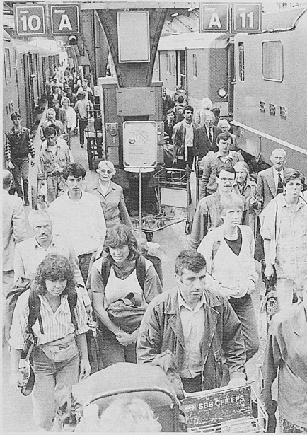
Bild 2. Stau im Bahnverkehr

Die Bekämpfung dieser Folgen wächst zum neuen Ziel der Verkehrspolitik heran. Die Mobilität muss ihren dominierenden Platz aufgeben und sich mit den Zielen der Siedlungsplanung, des Umweltschutzes, der Gesundheit, der Wohnlichkeit und anderen messen lassen.