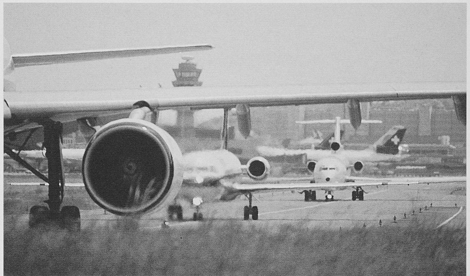
Bild 3. Stau im Luftverkehr

Bekannt Vorschläge im direkten Verkehrsbereich sind: bessere Koordination der Lichtsignalanlagen, Reduktion der Parkplätze für Pendler, Förderung des öffentlichen Verkehrs sowie Ver-