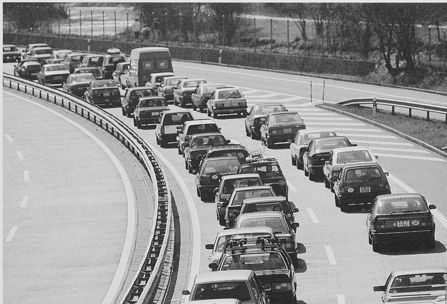
Bild 4. Stau im Strassenverkehr

nachfrage, sind als Planungsgrundlagen nicht mehr zulässig.