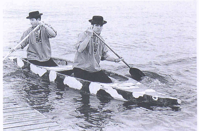
«La Mucca» mit schwarzweissem Design während des Wettkampfs in Heilbronn