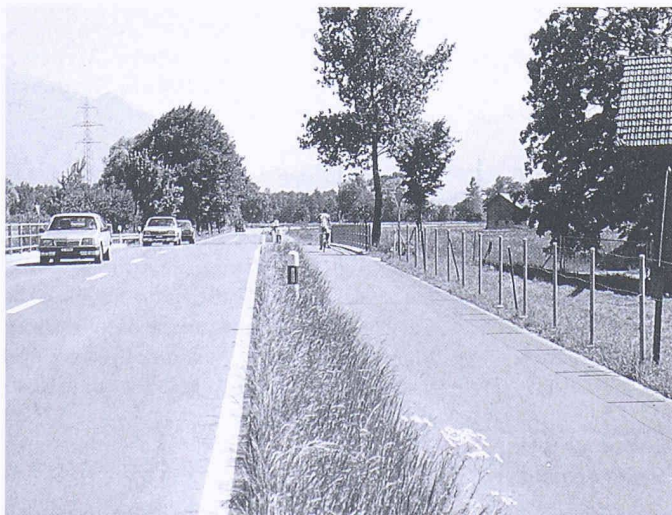
Bei der Melioration Sennwald konnte der Boden für den Radweg eigentumsässig ausgeschieden werden

Rudolf Weidmann, Meliorations- und Vermessungsamt des Kantons St.Gallen, Davidstr. 35, 9001 St.Gallen.