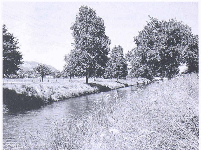
Die Magerwiesenstreifen dienen als Trenngürtel zum ackerbaulich genutzten Boden auf beiden Seiten des Kanals