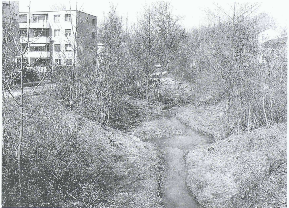
Ein grosses Anliegen des Wettbewerbs zum Europäischen Naturschutzjahr betraf die Sensibilisierung der Bevölkerung für ihren Lebensraum. Im Themenbereich «Wasserbau» galt die Hauptbestrebung dem Wiedersichtbarmachen von Wasserläufen in Siedlungen und Landschaft