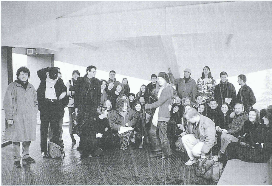
Studenten des dritten Jahreskurses der Mackintosh School of Architecture, Glasgow, Tanz auf dem Dach in winterlichem Schneetreiben, Maison de l'homme (Le Corbusier, 1965).

Architekturszene zur Diskussion. Ganz besonders gedankt sei all jenen SIA-Mitgliedern, die die Studenten durch interessante Bauplätze führten. Wozu die quiriligen Schotten fähig sind, haben sie bewiesen bei ihren Präsentationen im Architekturforum Zürich sowie im Rahmen einer SIA-Veranstaltung in Bern.