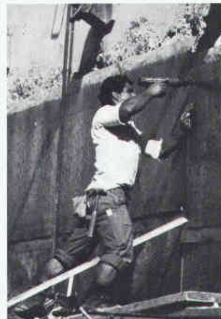
Problemlose Verlegung von Enkadrain CK auch auf unregelmässigem Untergrund