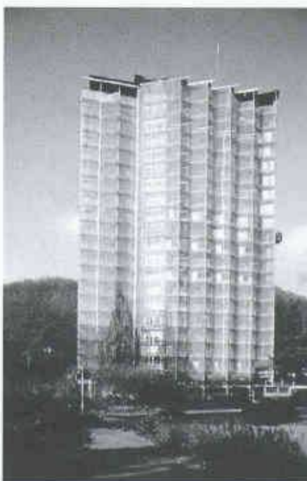
Kantonsspital Olten, Fassadensanierung Personalhaus

Stahlkonsolen: 2880 m Aluminiumprofile: 6000 m Glasfläche: 2200 m 2 (50 Tonnen) Isolationsfläche: 2400 m 2 Schrauben, Nieten: 16 000 Kleb- und Schlaganker: 3300