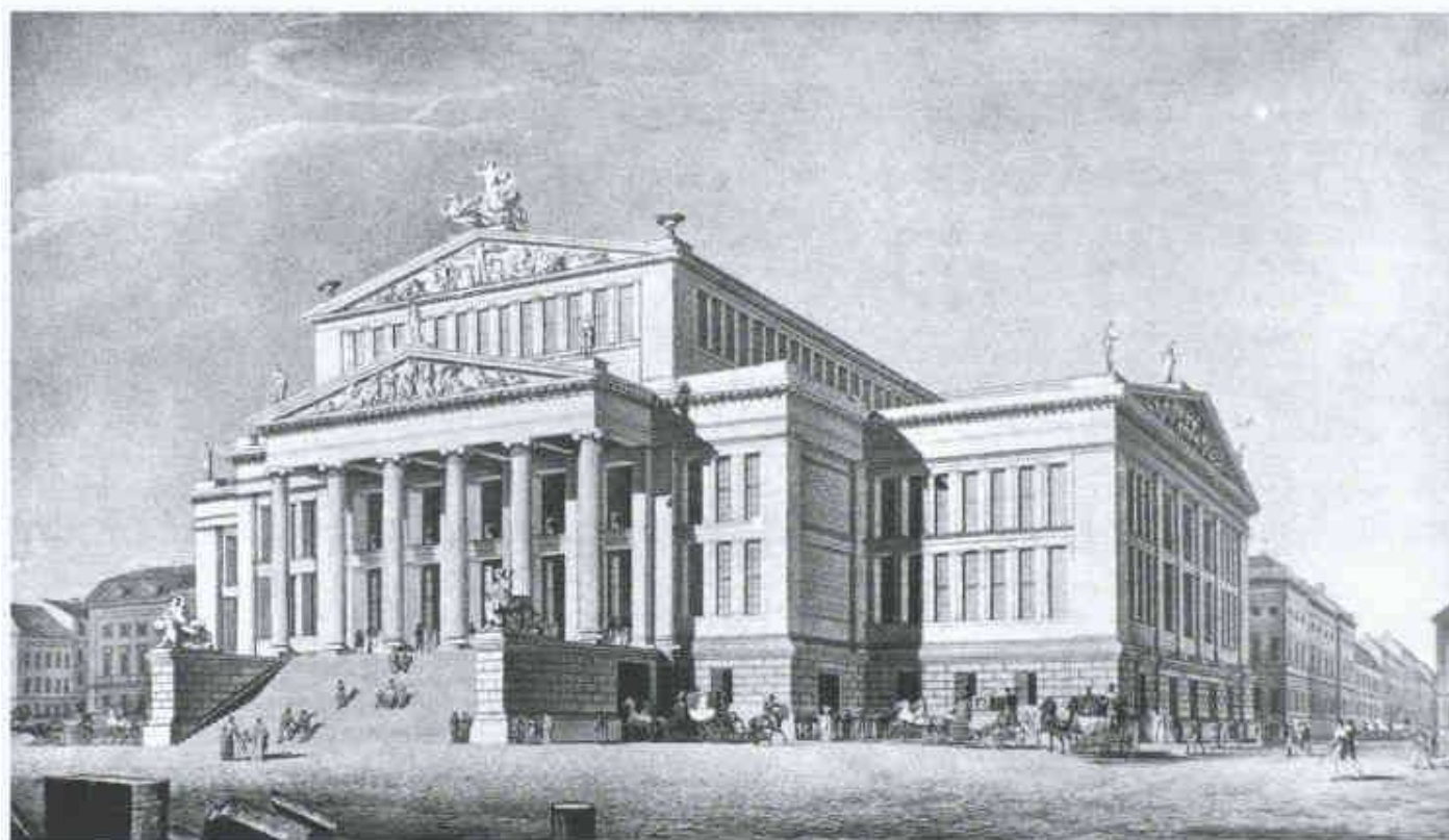
1 Karl Friedrich Schinkel, das Schauspielhaus am Berliner Gendarmenmarkt; Präsentationszeich-

nung des Entwurfs, Feder, Sepia 1818, Berlin, Schinkelsammlung des Kupferstichkabinetts SM 50,1.