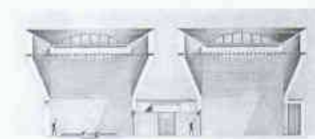
Schnitt durch Synagoge und Auditorium