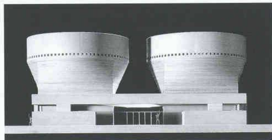
Modell mit der Eingangspartie