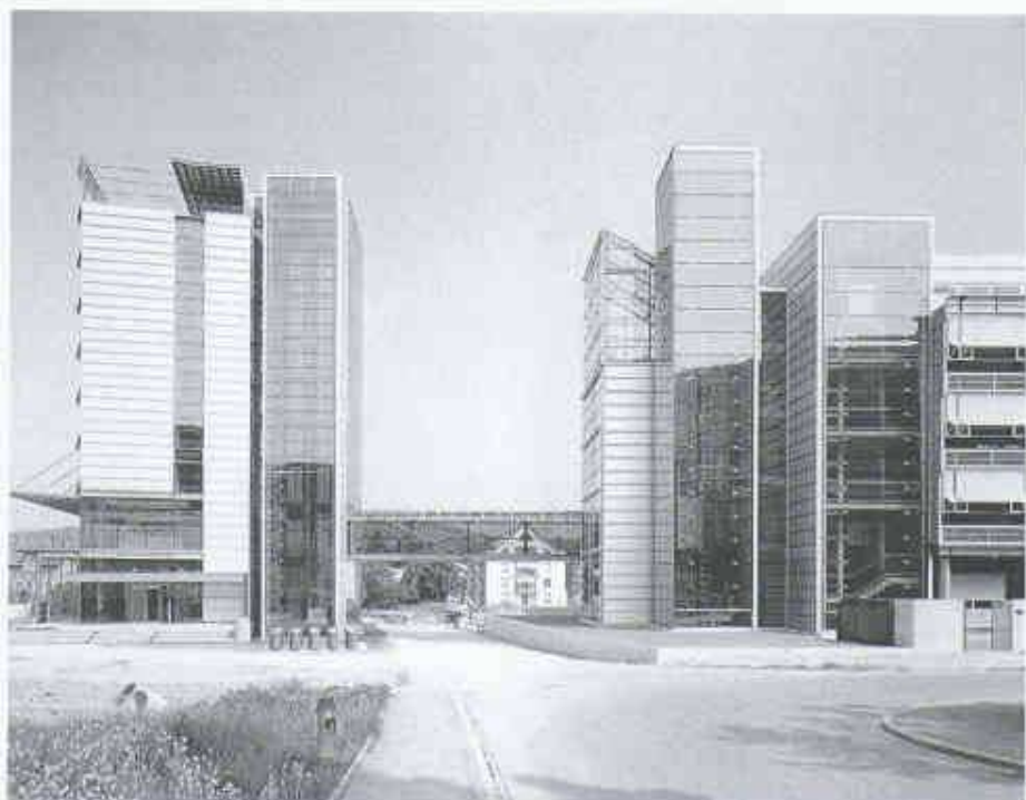
5 Empa St. Gallen, Verwaltungstrakt links, Labor- trakt rechts