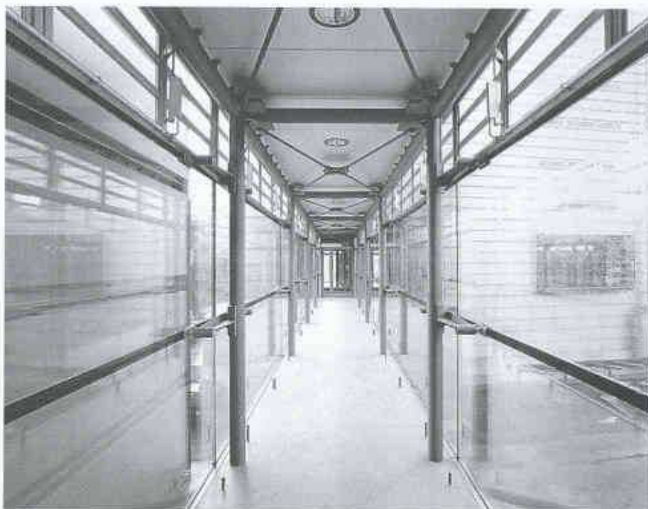
4 Empa St. Gallen, Verbindungspassierelle zwischen Verwaltungs- und Labortrakt

Die Empa St. Gallen wird mit dem Bezug ihres Neubaus ein Technologiezentrum für die Euregio Bodensee (genannt TEBO) in Betrieb nehmen, das mit Schwerpunkt der Jungunternehmerförderung und dem Technologietransfer verpflichtet sein wird. Aufgrund der Bedeutung, welche die Empa dem Gebiet des Technologietransfers in Zukunft beimessen möchte, hat sie sich auch entschlossen, in ihrer ab Anfang 1996 gültigen Organisation eine eigene Abteilung mit der Bezeichnung 'Technologietransfer' zu führen.