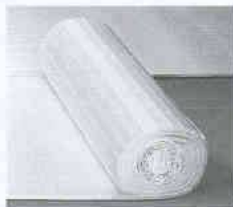
Goroll-2000-Wärme- und -Schalldämmrollen

Das günstige Preis-Leistungs-Verhältnis liegt in der einfachen Handhabung. Der Quadratmeterpreis für goroll 2000 ist vergleichbar mit dem der herkömmlichen Platten und mit zusätzlicher Folie. Bei goroll 2000 ist die dünne, elastische PE-Abdeckfolie bereits fertig verlegt und fixiert. Dies erlaubt einen schnellen, einfachen Verlegevorgang und spart Zeit und Geld. Trotz des günstigen Preises der goroll-2000-Rollen können die bekannt guten Trittschall- und Luftschalldämmwerte der gopor-T/SE-Produkte gewährleistet werden.