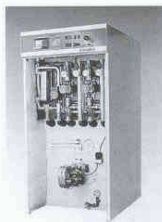
Modernste Heizungstechnik auf kleinstem Raum: Kombi-Heizschrank

Mit Stramax R 25 wird der Einbau einer Fussbodenheizung auch in bestehende Bauten möglich. Denn Stramax R 25 benötigt eine Aufbauhöhe von lediglich 25 mm - Dämmung und Lastverteilschicht inbegriffen. Die Kühldecke Stramax 2000 eignet sich als preisgünstige Lösung insbesondere in Kombination mit heruntergehängten Metalldecken beliebigen Fabrikats und kann auch nachträglich mit geringem Aufwand eingebaut wer-