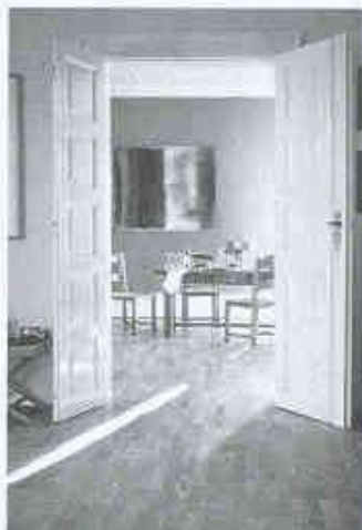
Wicanders AG zeigt Naturböden

Gebrüder Tobler AG 8902 Udorf Tel. 01/735 50 00 Halle 1, Stand 141