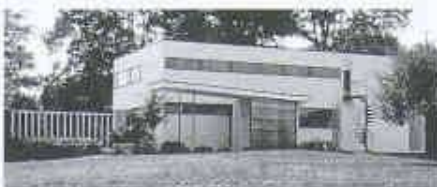
1 Walter-Gropius-Haus in Holzrahmenbauweise, erbaut 1939. Architekten: W. Gropius und M. Breuer, Lincoln, Mass., USA