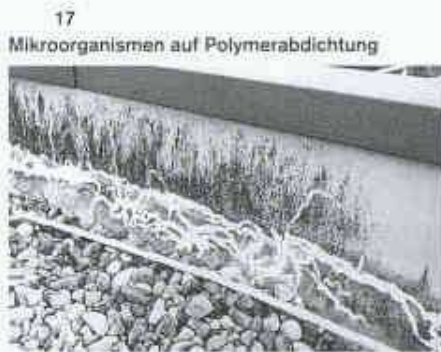
17 Mikroorganismen auf Polymerabdichtung