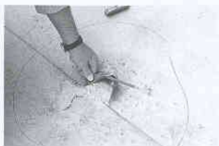
7 Unsorgfältige Verschweissung