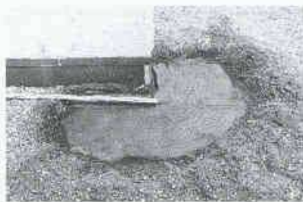
16 Gerichtete Risse in Deckbitumen infolge Spannungen in der Abdichtung

Falls man beim Betreten des Flachdaches Stiefel tragen muss, ist offensichtlich etwas mit der Entwässerung nicht in Ordnung (Bild 20). Die Gefahr, dass bei Was-