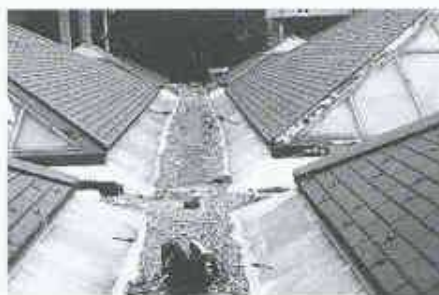
15 Frei gespannte Abdichtung

ginnt sich am Ende der Abdichtung gegen den vertikalen Schenkel des Winkelbleches abzuschälen. Hier ist es nur eine Frage der Zeit, bis eine Undichtigkeit auftritt.