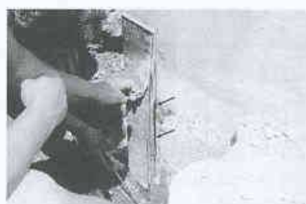
9 Keine Haftung der Kittfuge auf Anstrich