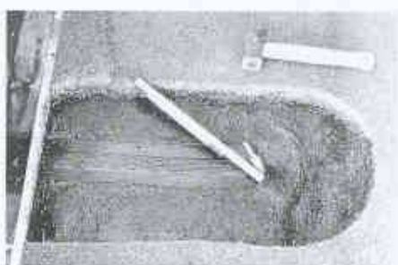
8 Keine Haftung der bituminösen Abdichtung auf der Blechdilataation