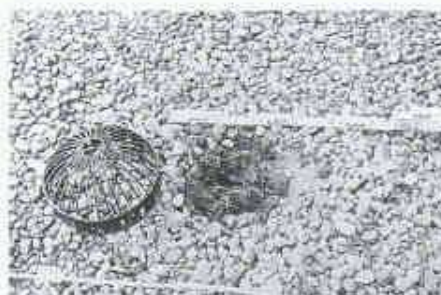
18 Zugewachsener Ablauf