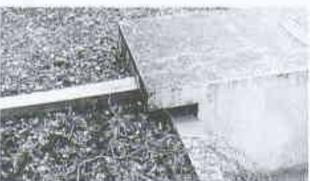
Vernachlässigter Unterhalt der Kittfugen