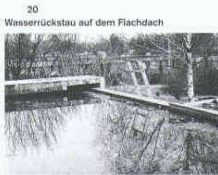
20 Wasserrückstau auf dem Flachdach