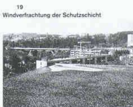
19 Windverfrachtung der Schutzschicht