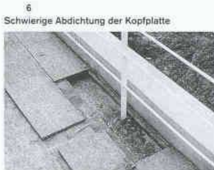
Das falsche Material am richtigen Ort