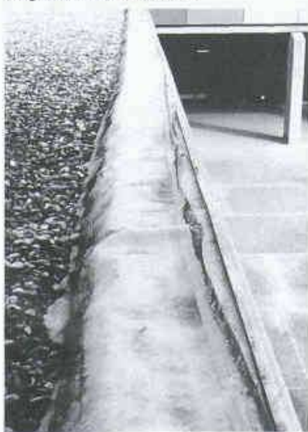
14 Ausgerissener Dachabschluss

Treten z.B. wegen fehlender Dilatationen oder zu grosser Abstände zwischen den Elementen Spannungen in der Abdichtung auf; werden die Risse gerichtet, was in Bild 16 sehr gut sichtbar ist. Sie be-