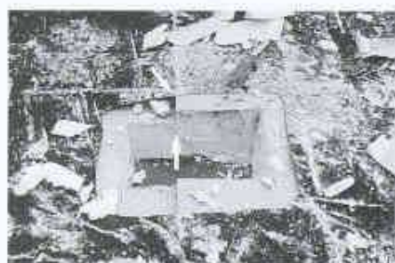
10 Verschiedene Wärmedämm-Dicken

Beim Schrumpfen von Abdichtungen werden durch die Abdichtung Zugkräfte ausgeübt, die in den Eckbereichen als typische Faltenbildung erkennbar werden. Die Zugkräfte, die beim Schrumpfen in der Abdichtung auftreten, können beachtlich