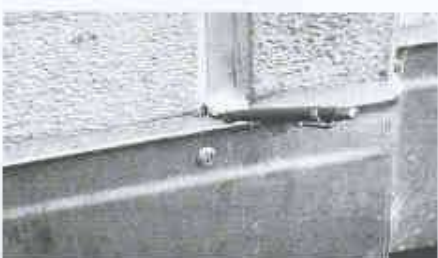
Beschädigtes Flachdach durch unsachgemässe Entwässerung der Kaminabdeckung