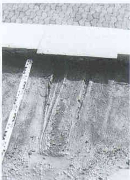
12 Aufreissen einer überstrichenen Blechdilataation