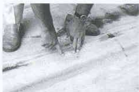
11 Dübel bei Belastung sichtbar