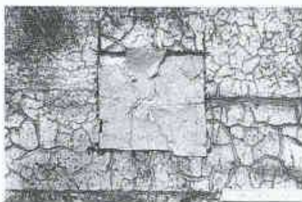
13 Risse in Deckbitumen zerstören Träger

sein. So ist es möglich, dass die Abdichtung aus der Halterung des Dachrandes gerissen wird (Bild 14).