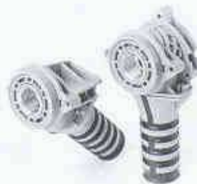
JRG-Sanipex-Anschlussdose \frac{1}{2} -16

Mit der Optimierung der Dose konnten aber auch Verbesserungen wie: