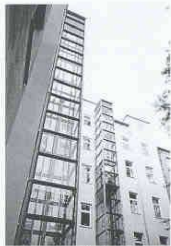
Aufzugsystem Schindler 200

Gleich zweimal hintereinander ist ein Produkt des Aufzugherstellers Schindler mit Design-Preisen ausgezeichnet worden. Nachdem das Industrie-Forum Design Hannover das Aufzugprogramm Schindler 200 bereits letztes Jahr würdigte und in die Liste der zehn Besten aufnahm, erhielt es nun in Frankfurt den deutschen Bundespreis für Produktdesign.