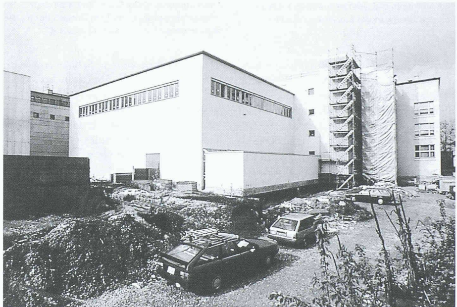
Blick auf den neu erstellten Erweiterungsbau mit angehängtem Schulungsraum

In den sechziger Jahren spitzte sich die Knappheit an Ausstellungs- und Arbeitsräumen zu. Auslagerungen wurden nötig, und auf exklusive Wechsausstellungen musste verzichtet werden. Um der bestehenden Raumnot abzuwehren, beschlossen 1979 Staat, Stadt und Burgergemeinde