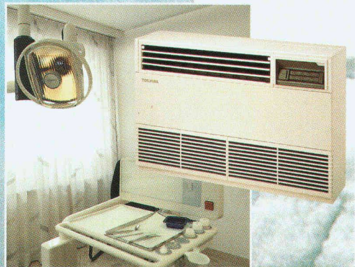
z.B. Wand-, Boden- oder Fenstergeräte für Praxis- und Besprechungsräume