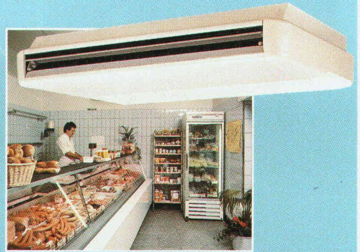
z.B. Decken- oder Deckeneinbaugeräte für Verkaufs- und Präsentationsräume