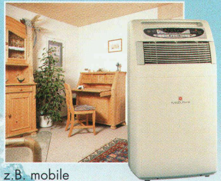
z.B. mobile Kompaktgeräte für Wohn- und Büroräume