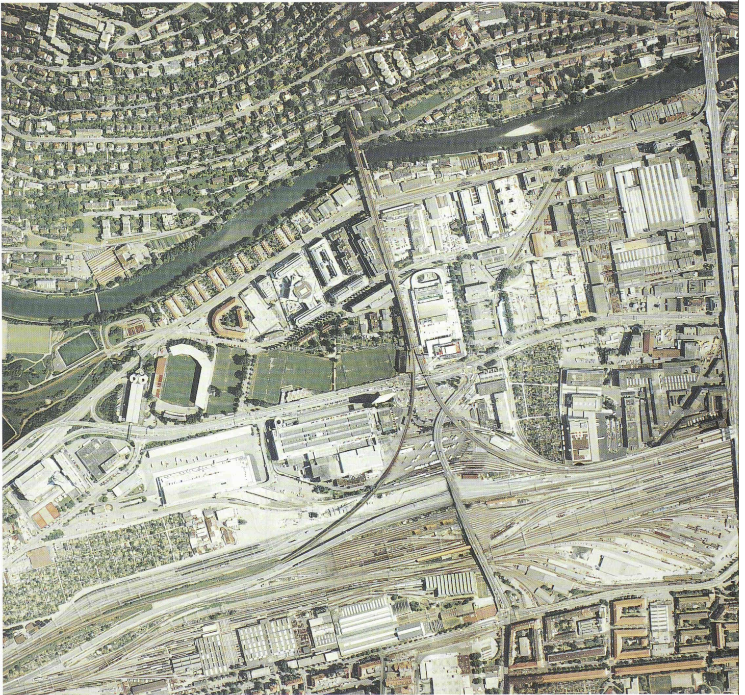
Luftbild Industriequartier, Stand 1990

Umweltbelastung, dem Leerbestand von Gebäudeflächen, der extrem hohen und instabilen ausländischen Wohnbevölkerung und der vernachlässigten Wohnsubstanz ergeben. Auf der andern Seite weist das Gebiet zahlreiche Entwicklungspotentiale in den verschiedensten Bereichen auf. Die Diskussionen im Forum haben ergeben, dass die Nutzung dieser Potentiale durch eine städtebauliche Aufwertung nicht einseitig zugunsten der Wirtschaft und zu Lasten der Bevölkerung oder vice