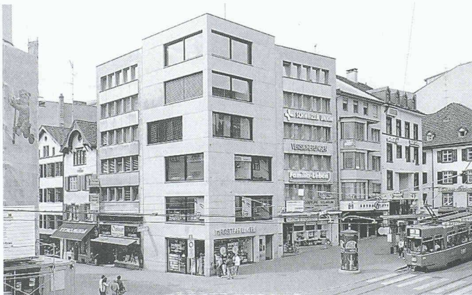
Wohn- und Geschäftshaus Steinenvorstadt, Diener & Diener