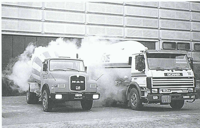
In einem Zisternenwagen wird der Flüssigstickstoff auf die Baustelle transportiert und dort direkt der Betonmischtrammel zugeführt

Ingenieure am Institut für Stahlbau haben gleichzeitig zwei Verbundträger fertiggestellt: Auf einem Stahlträger ruht ein Element aus Stahlbeton. Vor dem Beton-guss montierte man im Armierungseisen