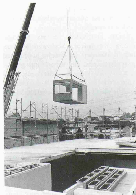
Eines von insgesamt 72 Modulen, aus denen der Neubau der Firma Schindler besteht

Durch den Zusammenschluss von Modulen und Deckenelementen entstanden 108 Raumzellen. Mit speziell entwickelten Stahlteilen sind die Module passgenau versetzt und statisch wirksam verbunden. An denselben Verbindungspunkten können die Module an den Montagekran gehängt und auf der Betonplatte be-