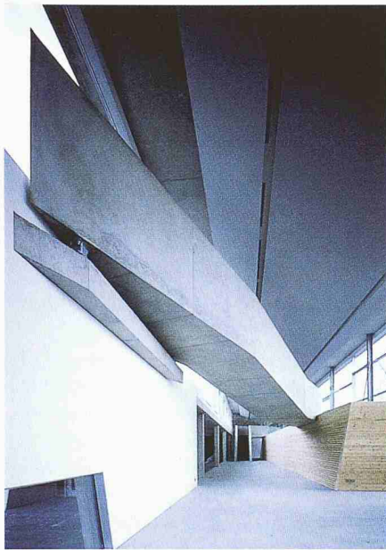
Öffentlicher Weg durch das Gebäude (Bilder: Christian Richters für Zaha Hadid)