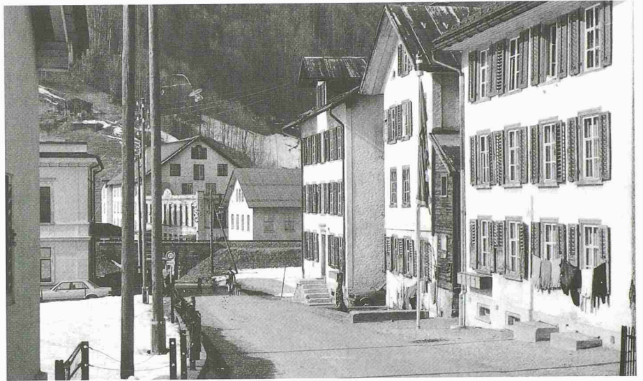
Diesbach, Fabrik und Arbeiterhäuser quer zum Tal