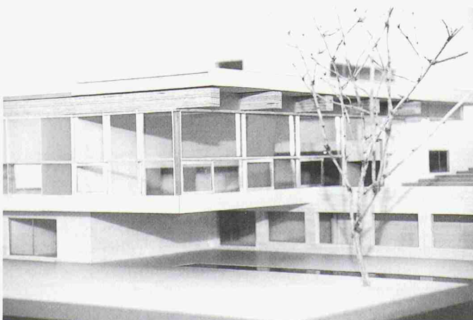
Neubau des Swiss-Re-Seminarzentrums im Modell

mer, die durch einen Restaurantanbau erweitert wird, und einem länglichen, zur bestehenden Anlage diagonal gesetzten Neubau. Für das insgesamt 69 575 m 3 Rauminhalt (SIA 116) umfassende Vorhaben haben die Architekten beschlossen, mit Architektenkollegen und Künstlern zusammenzuarbeiten: So wurde für die Gartengestaltung das Büro Kienast & Vogt beigezogen, für die Innenraumgestaltung der Villa Bodmer ist Günther Förg mitverantwortlich, Adolf Krischanitz für Teile des Neubaus, Hermann Czech für den Innenausbau von Restaurant und der kleinen Bar, allgemein unterstützt durch den Textilkünstler Gilbert Bretterbauer. Auf die Eröffnung dieses Gesamtkunstwerks, für welches eine ganze Gruppe verantwortlich zeichnet, darf man sich wohl freuen!