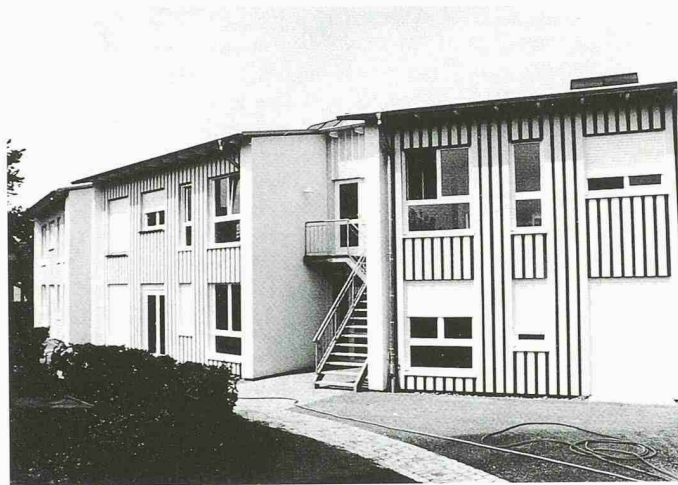
Vier-Gruppen-Kindergarten in Holzrahmenbau mit Putzfassade