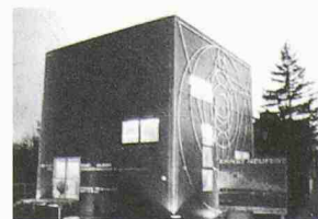
Neufert-Box in Gelmeroda/Weimar

Rechtzeitig zum 100. Geburtsjahr Ernst Neuferts ist nun im thüringischen Gelmeroda nahe Weimar ein Ausstellungsgebäude eröffnet worden. Es handelt sich um einen blauen Kubus in den Massen 10 x 10 x 10 Meter. Er wurde als Holz-Bausatz vorgefertigt, ist mit Eternit-Holz-colortafeln bekleidet und wurde innerhalb von 10 Tagen einschliesslich Ausbau aufgebaut (Architekt: Peter Mittmann, Planungs AG Neufert Mittmann Graf Partner). Bis zum 1. Mai 2000 ist dort die vom Bauhaus Dessau gestaltete Ausstellung «Ernst Neufert - normierte Baukultur im 20. Jahrhundert» zu sehen. Es ist die erste umfassende Ausstellung über das Werk Ernst Neuferts und dessen Einfluss auf die moderne Baugeschichte (geöffnet täglich 15-20 Uhr). In unmittelbarer Nachbarschaft kann das historische Neufert-Haus von 1929 besichtigt werden. Weitere Informationen unter www.neufert.de .