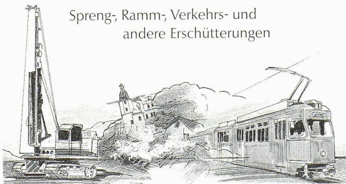
Spreng-, Ramm-, Verkehrs- und andere Erschütterungen