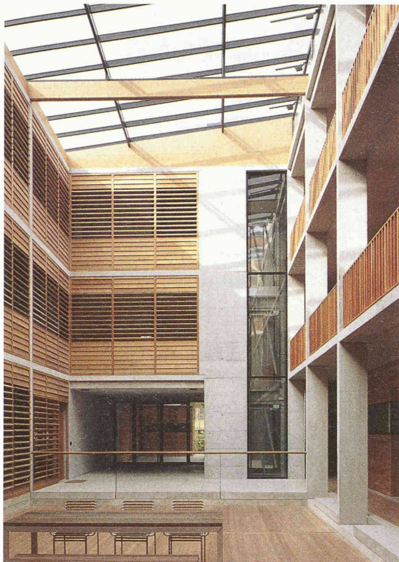
Die Zeitschrift «Bauen in Beton» enthält auch einen Beitrag zu neuer Architektur in Vorarlberg. Im Bild das Atriumhaus in Dornbirn von Roland Gnaiger und Udo Mössler. Der 1999 fertiggestellte Wohnblock mit vierzehn hochwertigen Wohneinheiten versteht sich als Alternative zum freistehenden Einfamilienhaus