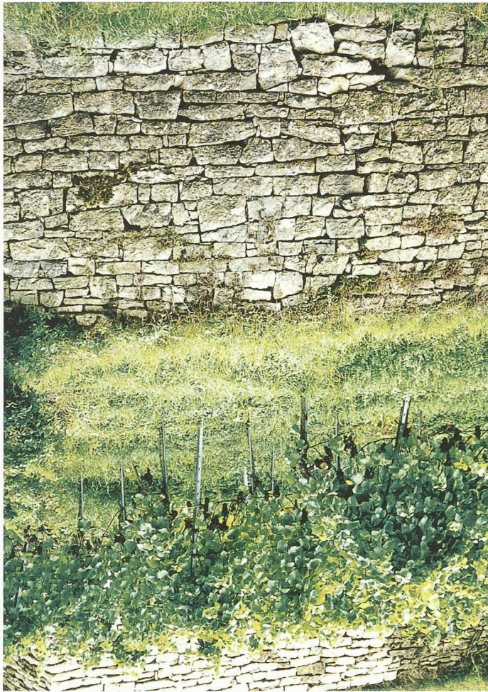
«Die Arbeit dort wieder aufnehmen, wo sie die Generation vor uns liegenliess.» Wiederherstellung von Trockenmauern

den zurückliessen, Einriffe, die man trotz «Begrünung» in fünfhundert Jahren noch sehen wird. Mahnrufe und Proteste führten immerhin zu einer Sensibilisierung und – als Folge davon – zu einer verbesserten Gesetzgebung und einem sorgsameren Umgang mit der kostbaren und unvermehrten Ressource Landschaft.