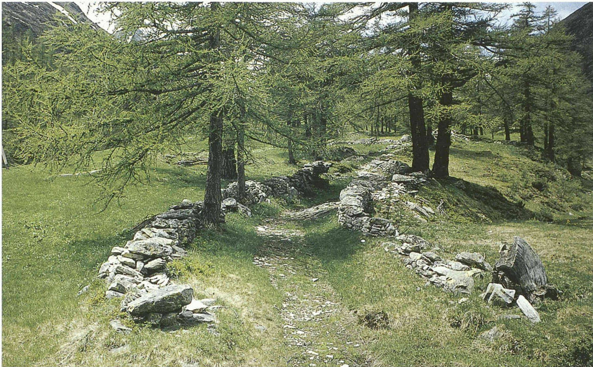
Touristische Angebote ohne Wertschöpfung? Historischer Passweg am Simplon. Ein Ecomuseum

der realen Umwelt durch virtuelle Welten, des Spontanen durch das Geplante sowie domestizierte Natur und kanalisierte Gefühle.