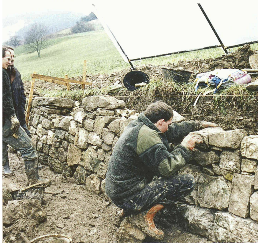
Freizeit – freie Zeit. Landschaft als sinnstiftende Aufgabe statt blosse Kulisse

Nun war viel von Wertschöpfung die Rede. Das ist nur die halbe Wahrheit. Der Tourismus ist ein vielschichtiges Phänomen, es gibt nicht nur die ökonomische Seite. Touristische Ziele entsprechen oft auch unausgesprochenen Sehnsüchten nach «dem verlorenen Paradies», sind Symbole für vieles, was im Alltag zu kurz kommt. Die Polarität könnte nicht grösser sein: Hier die Produktionswelt, die geprägt wird von Anpassung an die Zwänge einer durchorganisierten Welt, an technische Vorgaben, Effizienz und permanente Erfolgskontrollen. Der Preis sind der Ersatz des Authentischen durch das Ersatzprodukt,