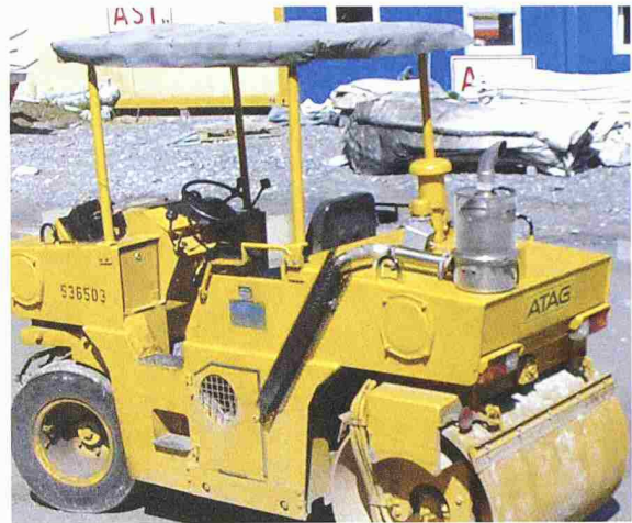
Der Partikelfilter an dieser Strassenwalze reduziert den Schadstoffausstoss – insbesondere an Russ – an der Quelle