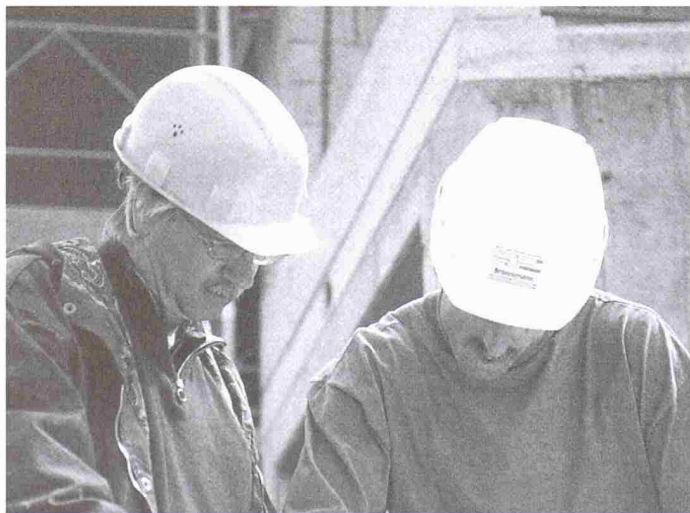
Wer ist jetzt für die Sicherheit auf dieser Baustelle zuständig? Die von der Suva herausgegebene Mustervereinbarung schafft Verwirrung und erhöht die Sicherheit nicht

Über die Verantwortung für die Sicherheit und Gesundheit von auf Baustellen Beschäftigten bestehen bereits seit langem gesetzliche und vertragliche Regelungen. Doch ist darüber eine Diskussion entbrannt, seit die Suva zusammen mit dem Baumeisterverband und den Gewerkschaften das Muster zu einer «Vereinbarung über die Gewährleistung der Sicherheit und des Gesundheitsschutzes während der Ausführung von Bauarbeiten» erstellt und in Umlauf gebracht hat. Etliche öffentliche Bauherren haben seither in Anlehnung an das Suva-Modell eigene ähnliche Formulare herausgegeben. Von Planungsbüros, welche den Zuschlag für einen öffentlichen Auftrag erhalten, wird die Unterschrift unter solche Vereinbarungen gefordert. Selbstverständlich ist die Unfallverhütung ein wichtiges Anliegen. Doch diese Vereinbarungen nützen nichts und schaffen grosse Probleme. Sie spielen dem Bauherrn bzw. der Bauleitung neue, erhebliche Verpflichtungen zu, die weder im Gesetz noch in den weit verbreiteten und allgemein anerkannten Musterverträgen des SIA vorgesehen sind.