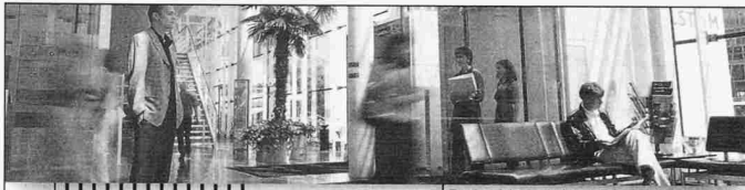
Baden bietet 21'000 Arbeitsplätze

Zur Realisierung von Schulbauten suchen wir für Bauleitung Architekt HTL/Bauleiter mit ausgewiesener Erfahrung bei vergleichbaren Bauaufgaben. Chiffre: K88748/B Künzler-Bachmann Medien AG, Postfach 1162, 9001 St.Gallen