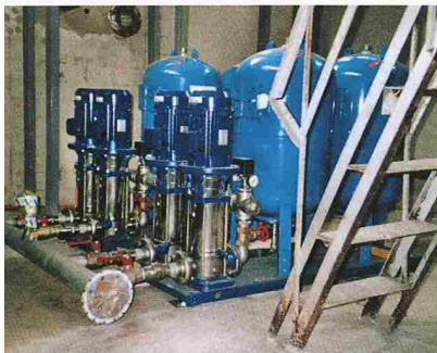
Im Spital von Dobrich (Bulgarien) wurde das Trinkwasserreservoir mit Druckerhöhungsanlage saniert

Bundesamt für Energie 3414 Oberburg 034 422 07 85, Fax 034 422 69 10 www.waermepumpe.ch/fe Kälte-Wärme-Technik AG 3123 Belp 031 818 16 16, Fax 031 818 16 26 www.kwt.ch