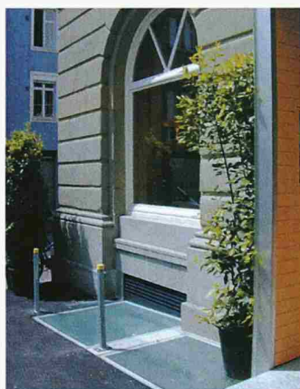
Küche des Casino-Theaters von Giacobbo in Winterthur (Aussen- und Innenansicht)

Heliobus AG 9000 St. Gallen 071 278 70 61, Fax 071 278 41 22 www.heliobus.com