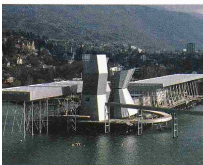
Drei im Rahmen des Jugendsolarprojektes in Biel installierte Solaranlagen werden künftig auf Schulhausdächern Solarstrom produzieren