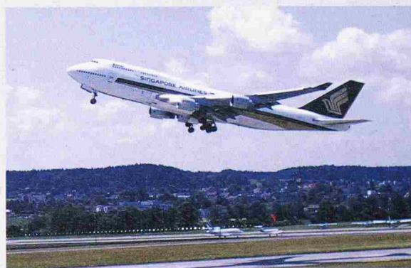
Planen im Fluglärm – die Gemeinde Rümlang gehört zu den Flughafen-Anrainergemeinden, deren Bauzonen von der künftigen Verteilung der Flugbewegungen abhängen

Kommunikation zwischen den Akteuren. Unter dem Titel «Wie lebt der Immobilienmarkt in der Flughafenregion mit den Unsicherheiten der laufenden Planungsverfahren?» findet am Nachmittag ein Workshop mit Urs Meier, Architekt und Raumplaner, statt; ein zweiter Workshop, «Zur Ankurbelung des Wohnungsbaus braucht die Stadt die Immobilienwirtschaft», wird von Mark Würth, Fachstelle für Stadtentwicklung Zürich, geleitet. Anmeldung (bis 6.11.) und Informationen: VLP-Aspan, 031 380 76 76 oder tagung@vlp-aspan.ch.