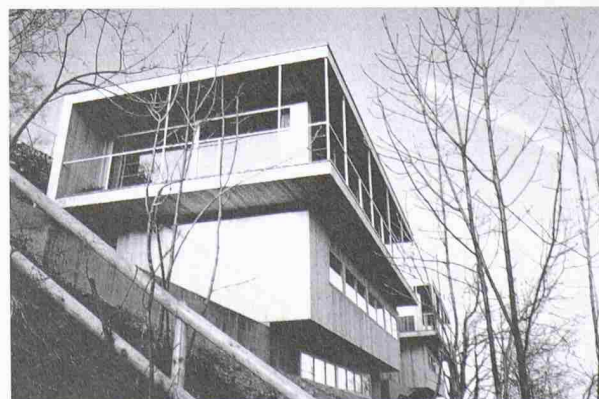
Ausgezeichnetes Projekt: Einfamilienhäuser Höhenweg, Speicher/AR Architekt: Daniel Cavelli, St. Gallen

Die Jury «Auszeichnung gutes Bauen 1996–2000» hat insgesamt acht Bauwerke ausgezeichnet und weitere sechs Anerkennend hervorgehoben. Die Ausstellung der ausgezeichneten Bauten empfängt die Besucher gleich im Eingangsbereich. Zudem sind mehrere Referate und Vorträge dem Thema Gutes Bauen gewidmet. Weitere Infos unter Tel. 052 722 44 55 oder www.immo-messe.ch .