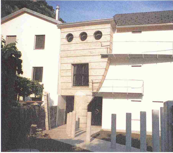
Für das Können des Architekten wirbt dieser eigenwillige Neubau in einer bestehenden Häuserzeile in San Vittore (Misox). Architekt Luigi Cereghetti

erzählen aus der Dorfgeschichte». Oder Architekten können bei den Kursen für zukünftige Bauherren, wie sie Banken periodisch anbieten, als Referenten auftreten. Die Bekanntheit ist jedenfalls eine wichtige Voraussetzung für Aufträge.