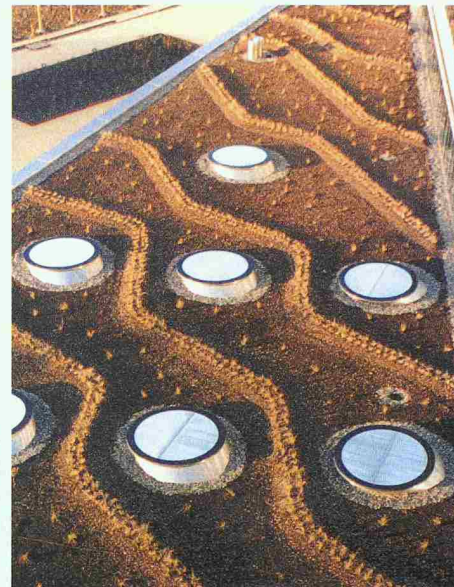
Dachgarten «Aquabelle» in Montreux, Yvon Vannay, A. Forster S. A., Monthey