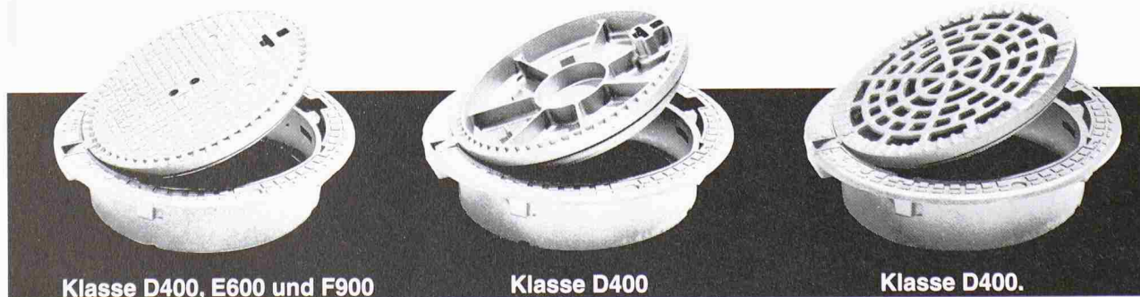
Klasse D400, E600 und F900

mit oder ohne Verriegelung (mit oder ohne Belüftungslöchern in D400).