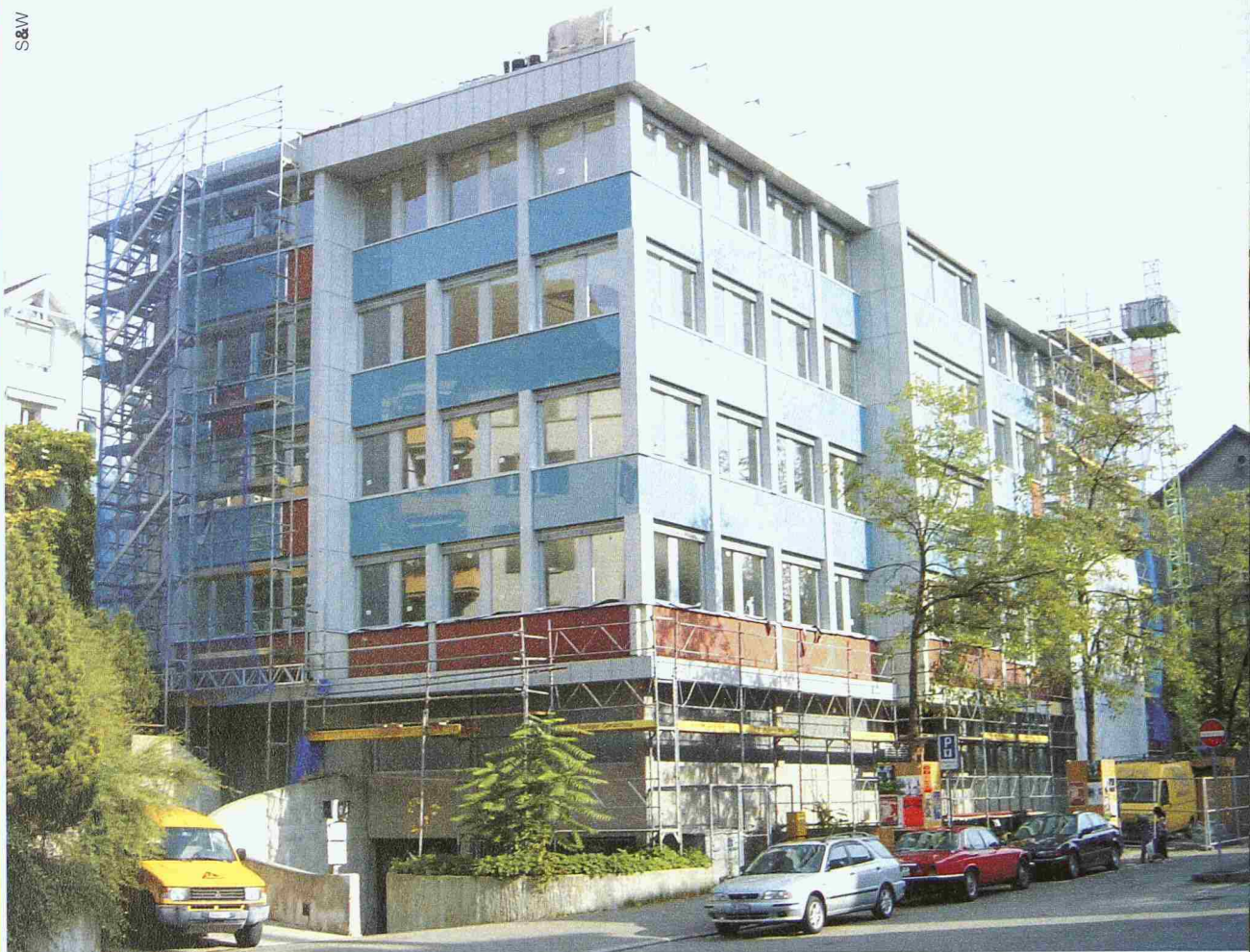
Geschäftshaus Höggerstrasse, Zürich