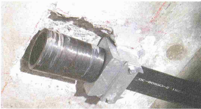
Spannkopf für CFK-Lamellen «Stress Head»