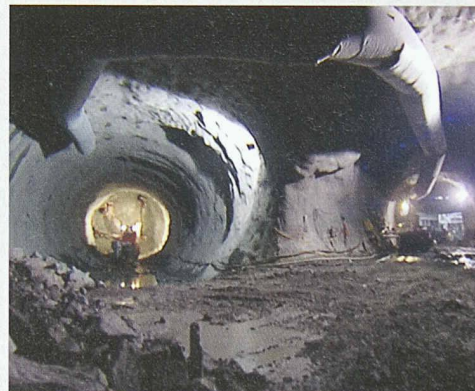
Am 27. November strahlt SF 1 den ersten von vier Dokumentarfilmen über den Neat-Bau aus (Bild: Blick in den Stollen)

wicklung, sondern auch die des Umfeldes. Den Auftakt macht der Film «Das Loch». Der Film spielt in Sedrun. Autor Gieri Venzin zeigt, was es heisst, wenn plötzlich Hunderte von Tunnelarbeitern aus den verschiedensten Ländern im Bündner Oberland arbeiten und leben. Der Film zeigt aber auch, wie sich die Bündner Bevölkerung ihre Zukunft mit dem Tunnel vorstellt. Ausstrahlung: Do, 27. November, 20h; Zweitausstrahlung Fr, 28.11., 13.15h; SF 1.