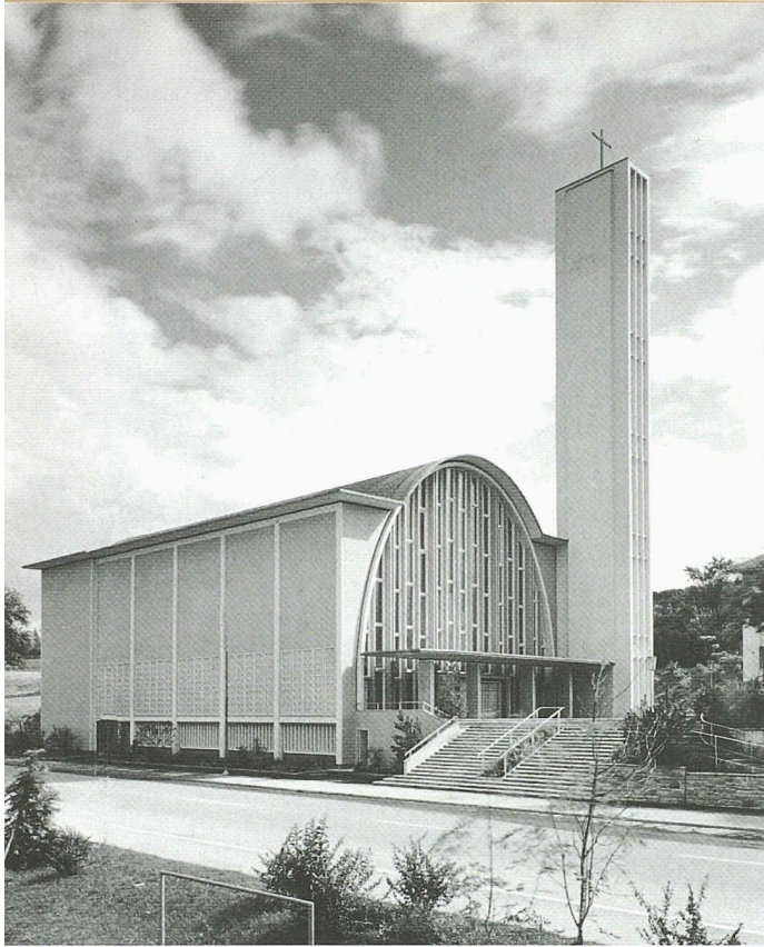
Die St.-Gallus-Kirche in Zürich Schwamendingen, ein Beispiel der Betonkirchen von Ferdinand Pfammatter