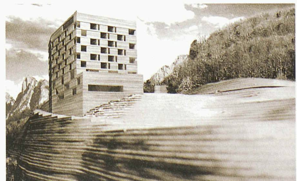
Preisgekrönte Diplomarbeit: ein Rehabilitationshotel in geschichtsträchtiger Landschaft über dem Vierwaldstättersee