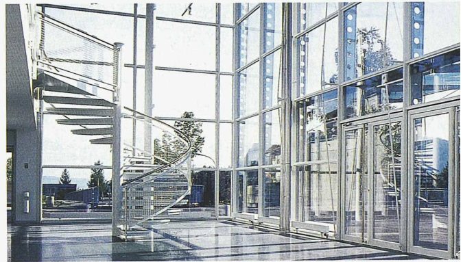
Die Fassade dieser Mehrzweckhalle bedingt einen hocheffizienten Sonnenschutz (Schulanlage Schliern, Schliern bei Köniz; Frank Geiser Architekten + Planer AG; Bild: Glas Trösch)

Glas Trösch | 4922 Bützberg 062 958 53 81 | 062 958 53 90 www.glastroesch.ch