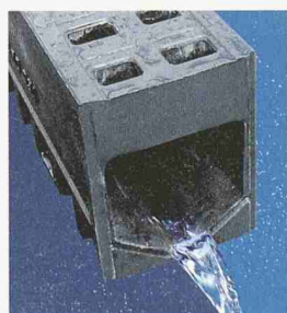
ACO DRAIN Monoblock

ACO DRAIN Monoblockrinnen - Garant für Sicherheit, Stabilität und Funktionalität dank Monogusskonstruktion. Anwendung in allen Bereichen der Entwässerung. Speziell geeignet für den Einbau mit Verbundsteinen oder Kiesbelägen im Garten- und Landschaftsbau. Einfache Reinigung dank Revisionselement. Neueste Produktionsmethoden ermöglichen die Fertigung der Rinnen in einem Stück ohne lose Teile.