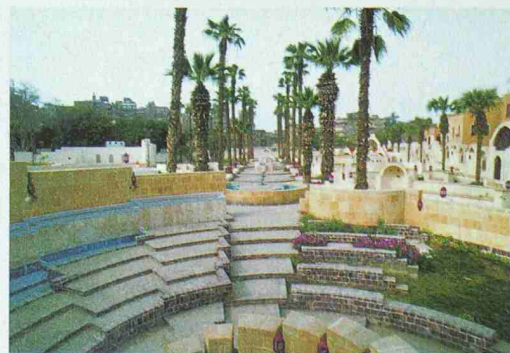
Die Palmen-Allee im Kinderkulturpark in Kairo, 1983–1992; Architekt: Abdelhalim I. Abdelhalim (Bild: ifa-Galerie Stuttgart / Abdelhalim)

Formen den Niavaran-Park in Teheran, und Abdelhalim I. Abdelhalim entwickelte die Farafr Oase im Süden Ägyptens und einen Kinderkulturpark in Kairo nach traditionellen Mustern und zeitgenössischen Anforderungen. Die ifa-Galerie Stuttgart stellt Projekte dieser Architekten – von der Stadt- und Oasenplanung bis zur Gestaltung privater Gärten – in Form von Plänen, Skizzen, Fotos und Filmen vor. Eröffnung: Do, 2.9., 18 h. Ausstellung: 3.9.–7.11., Di–Fr 12–18 h und Sa+So 11–16 h. Auskunft: Tel. +49 711 2225 173 oder www.ifa.de.