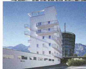
K. Schmalhofer, O. Nadel: Ama-lienbad (1923–26) ; F. Tamm: Flaktürme (1942–44) ; L. Welzenbacher: Turmhotel Seeber (1930–31) , mit Parkhotel von Henke und Schreieck (2003) ; Bilder: azw

Führungsanspruch des Regimes, während die in Wien angesiedelten Vertreter der Moderne zumeist vertrieben wurden.