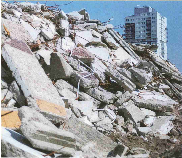
Wächst nach dem Abbruch Subkultur als Heilung für die entleerte Stadt? Trümmer eines Plattenbaus in Halle-Neustadt