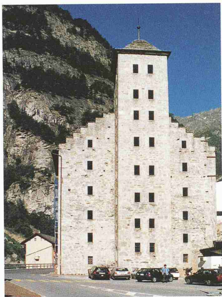
Der Stockalperturm in Gondo VS: nach der Instandstellung mit Sälen, Museum und Café