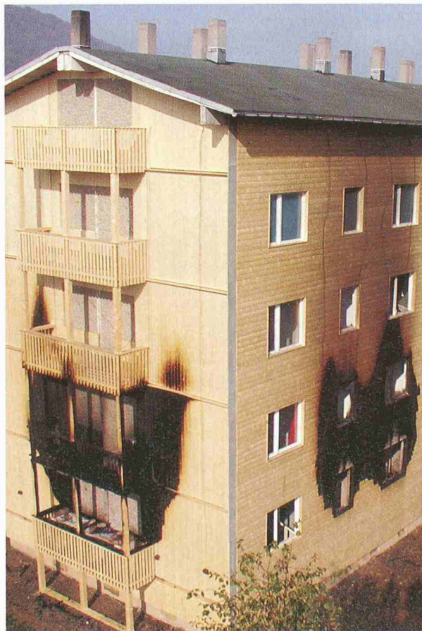
Konstruktive Brandschutzmassnahme bei mehrgeschossigen Holzbauten: Die Hinterlüftung wird in jedem Geschoss unterbrochen, so bleibt der Brand lokal begrenzt