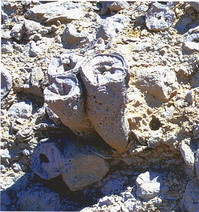
Die fossilen Muschel-schalen aus der Kreidezeit dienen als Material für geochemische Untersuchungen zur Erderwärmung. Je nach Wassertemperatur bauten sie unterschiedliche Mengen verschiedener Sauerstoff-Isotope in die Schale ein