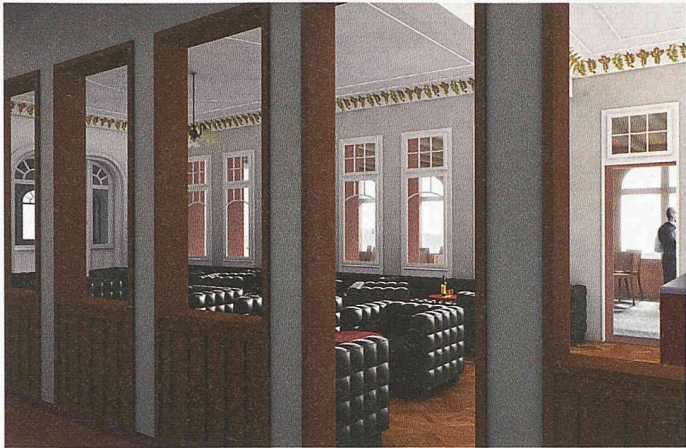
Blick durch den roten Salon, der Richtung Hotelhalle geöffnet wird (Weiterbearbeitung, Patrik Seiler)