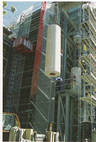
Gottfried Sempers Stadthaus. Letzte Phase der spektakulären Arbeiten: 13. bis 17. Juni (Bild: Johann Frei)

(bö) Erst als wieder Teile des Portikus herunterfielen, entschied der Stadtrat, die Renovation doch noch durchzuführen. Seit 1993 besteht ein Projekt, um das von 1865 bis 1869 nach Plänen von Gottfried Semper erstellte Stadthaus aussen zu renovieren. Unter Leitung des Winterthurer Architekten Johann Frei wurden die Arbeiten im November 2003 begonnen und werden bis Ende 2007 abgeschlossen sein. Es ist bekannt, dass einzelne Trommeln der Portikussäulen wegen starken Frosts bereits während der Bauzeit im November 1867 geplatzt sind. Sehr auffällig sind die innerhalb weniger Jahre immer grösser werdenden Schäden an den Oberflächen der Säulen. Nach mehreren Versuchen hat das Projektteam entschieden, an 2 von 4 Säulen die beiden untersten Trommeln und an allen Säulen die Basen zu ersetzen. Das Kapitell und die oberste Säulentrommel (Gewicht ca. 5.5 t) wie auch der Architrav mit der anteilmässigen Auflast von Gebälk, Geison, Tympanon und Dach (ca. 60 t) müssen dabei abgefangen werden. Die Kosten betragen rund 370 000 Fr. Davon kostet allein die Gewinnung, Herstellung und Lieferung der Säulenelemente aus Bollinger Sandsteinen rund 100 000 Fr. Teile der einen Säule wurden Ende Mai ausgewechselt. Vom 13. bis 17. Juni sind die Arbeiten an der letzten Säule zu sehen.