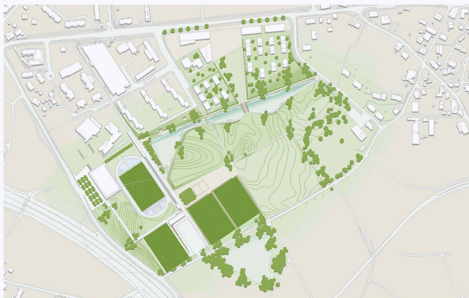
Parkanlage Gries in Volketswil (Weiterbearbeitung, asp Landschaftsarchitekten )