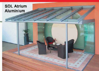
SDL Atrium Aluminium