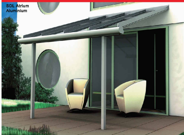
SDL Atrium Aluminium